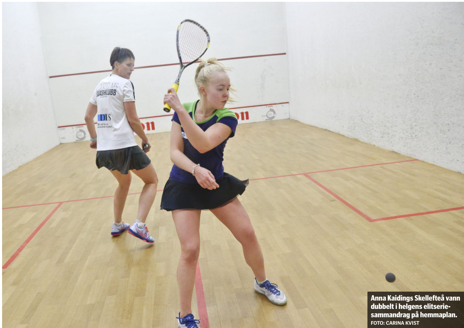
Anna Kaidings Skellefteå vann dubbelt i helgens elitserie-sammandrag på hemmaplan.