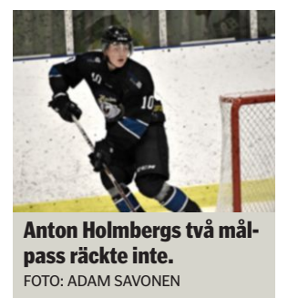
Anton Holmbergs två målpass räckte inte.

ISHOCKEY Överkalix leder Alltvåan Norra efter helgens matcher. Den tidiga seriefinalen mot Clemens slutade med seger på övertid för Överkalix.