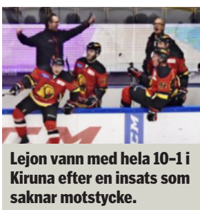
Lejon vann med hela 10-1 i Kiruna efter en insats som saknar motstycke.